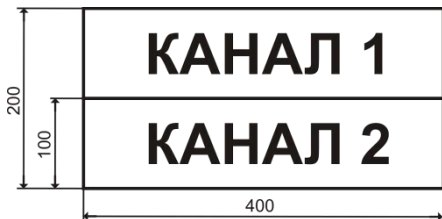
Рисунок 1 – Световые каналы табло.

Каналы светового табло разделяются по горизонтальной оси видимой части табло.